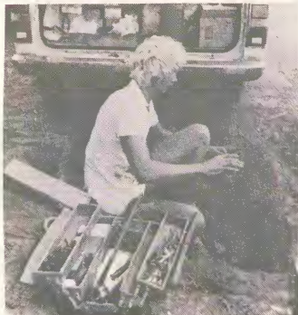
E trabaonan pa modernisa nos sistema di telecomunicacion ta continua y cu ayudo di expertonan hulandes Servicio Telefonico ta spera di por yuda mas persona cu un abono di telefon.